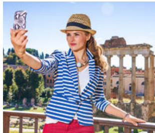
Un voyage dans l'histoire grecque et romaine