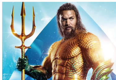
Un accès privilégié à la culture